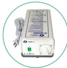
Bomba de aire regulable