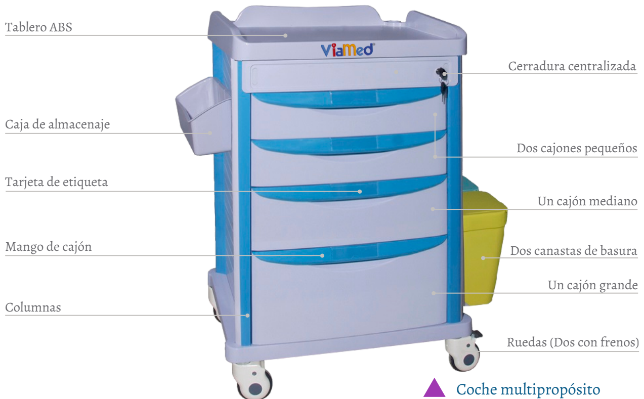
▲ Coche multipropósito MT500 625*475*930 mm